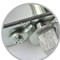
Calce perfecto de la traba