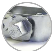
Recubrimiento con cincado electrolítico