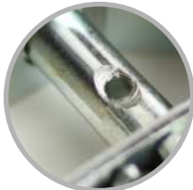
Agujero del perno fresado