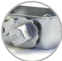
Recubrimiento con cincado electrolítico